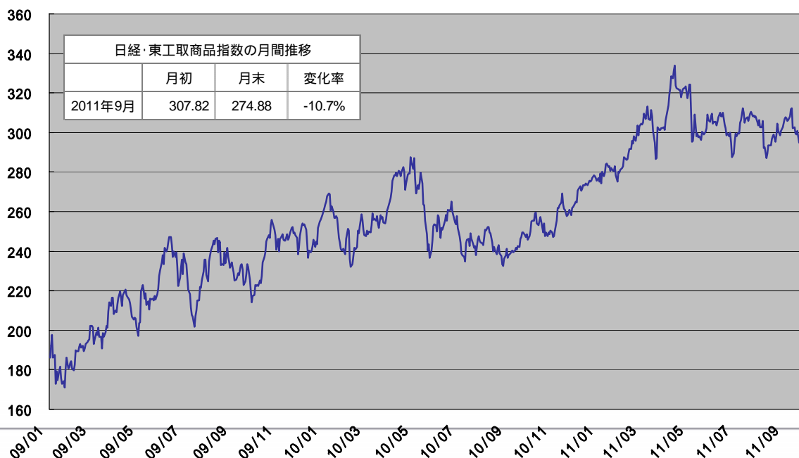
日経・東工取商品指数の推移