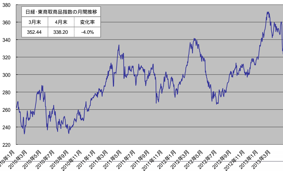
日経・東商取商品指数の推移